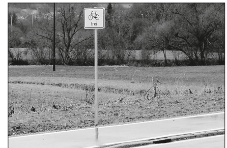
Rad frei B 19 zwischen Sulzbach und Laufen