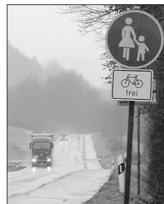
Gehweg Rad frei B 19 südlich von Gaildorf

Radfahrende können bei der Beschilderung „Rad frei“ wählen, ob sie die Fahrbahn benutzen oder auf dem Gehweg fahren wollen.