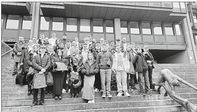
Die Schülerinnen und Schüler aus dem Partnerkreis Zamosc wurden im Landratsamt in Schwäbisch Hall begrüßt.