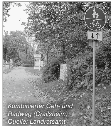
Kombinierter Geh- und Radweg (Crailsheim) Quelle: Landratsamt

Quelle: StVO (Radweg, getrennter Geh- und Radweg, kombinierter Geh- und Radweg)