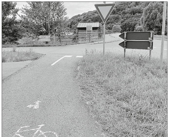
Furt mit Wartepflicht für Radfahrende bei Geislingen

Eine weitere große Gefahrensituation stellt der „Tote Winkel“ dar. Bei Pkws, Lkws und Bussen bestehen direkt vor und hinter dem Fahrzeug sowie an beiden Fahrzeugseiten Bereiche, die der Fahrende trotz der Spiegel nicht einsehen kann. An Kreuzungen und Einmündungen entstehen dadurch Gefahrensituationen, wenn Radfahrende geradeaus fahren, ein Kraftfahrzeug aber rechts abbiegen will.