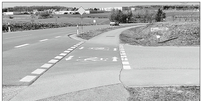
Furt mit Vorfahrt für Radfahrende Schrozberg

Ist der Weg mehr als 4 bis 5 m von der Fahrbahn abgesetzt, sind Radfahrende gegenüber dem Kfz-Verkehr wartepflichtig. Dies gilt auch, wenn das Zeichen Vorfahrt achten und eine entsprechende Bodenmarkierung nicht vorhanden sind. Es empfiehlt sich in solchen Situationen – auch bei Vorfahrt – immer besondere Vorsicht walten zu lassen und ggf. den Blickkontakt mit den anderen Verkehrsteilnehmenden zu suchen.