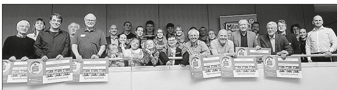
Die Botschafterinnen und Botschafter mit den Vertreterinnen und Vertretern der ausgewählten Spendenempfänger.