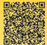
Christian, einer von uns.