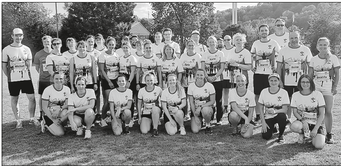
Die Läuferinnen und Läufer des Landratsamts beim AOK-Firmenlauf

Wir gratulieren unserem ersten 4er-Team der Frauen zu einem sehr erfolgreichen 3. Platz von den insgesamt 34 Damen-Teams. Auch unserem ersten Mixed-Team gratulieren wir zu einem erfolgreichen 5. Platz von insgesamt 61 Teams sowie unserem ersten Herrenteam zum 9. Platz.