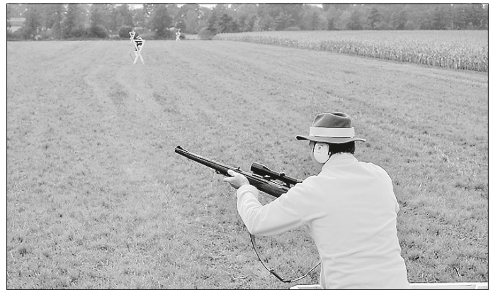
Ein wirksamer Kugelfang durch erhöhte Ansitzeinrichtungen und begrenzte Schussentfernung machen Erntejagden bedeutend sicherer

Weitere Hinweise und Empfehlungen finden sich in der SVLFG-Broschüre „Sichere Erntejagd“. Sie kann unter www.svlfg.de und mit dem Suchbegriff „B44“ kostenlos aus dem Internet heruntergeladen werden. Druckexemplare können telefonisch unter 0561/785-10339 oder online unter www.svlfg.de/broschueren-bestellen angefordert werden. Die Unfallverhütungsvorschrift Jagd findet sich unter dem Suchbegriff „VSG 4.4“.