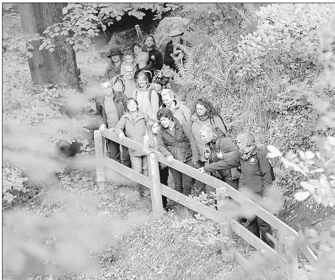
Mit den Naturparkführern zu kühlen Wäldern und Schluchten (hier Teufelskanzel oberhalb von Gschwend-Rotenhar)

In den warmen Sommermonaten ist es mit den Naturparkführern in den kühlen Wäldern und Schluchten des Naturparks Schwäbisch-Fränkischer Wald besonders schön. Speziell für die jungen Gäste werden Ferienfreizeiten oder die integrative Veranstaltung „Ebnisee für alle“ angeboten. Alle Termine finden sich in der „Naturpark aktiv“-Broschüre und auf www.die-naturparkfuehrer.de .