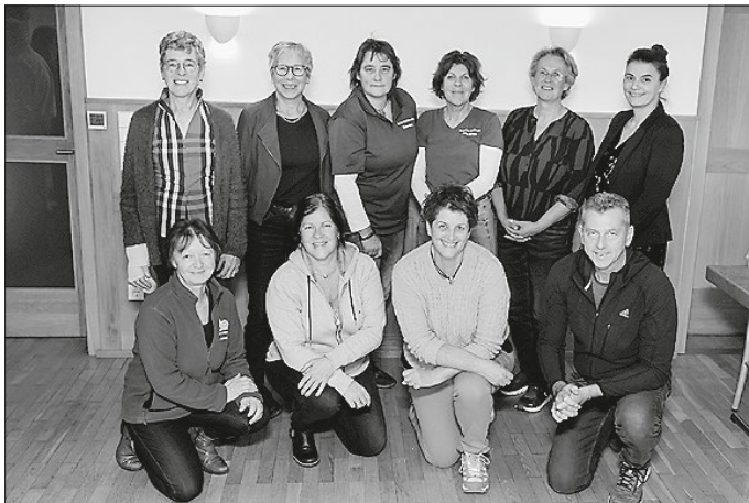
Der frisch gewählte Vorstand und Beirat der Naturparkführer Schwäbisch-Fränkischer Wald

Nach dem offiziellen Teil der Mitgliederversammlung folgten noch ein gemütliches Beisammensein und ein reger Austausch der Naturparkführer untereinander.