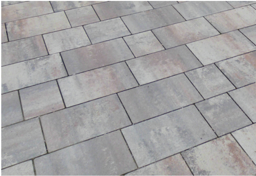
Belag Ruf; il sentiero, Farbe Muschelkalk