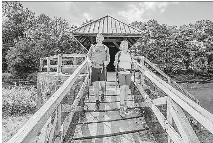
Auf dem Ockenauer Steg bei Kirchberg kreuzen die Wanderer die Jagst.