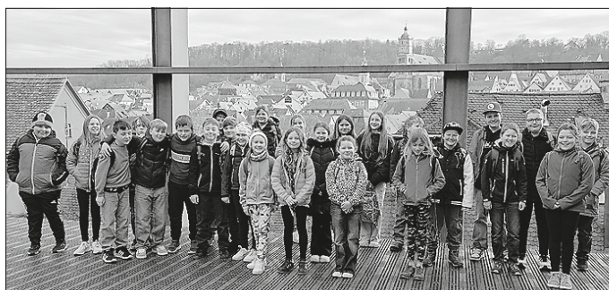
Schulbericht Klasse 4

Wir haben uns dann vor ein Bild gesetzt, das aussah wie ein Fingerabdruck mit Nägeln. Danach sind wir in einen Raum gegangen, in dem es ganz dunkel war. Dort gab es ein Bild mit Leuchtsternen.