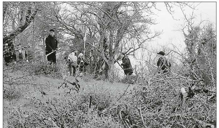
Die Mitarbeitenden der Apleona Südwest GmbH schneiden die Misteln von den Bäumen; Naturpark Schwäbisch-Fränkischer Wald.

Die Apleona Südwest GmbH hat am 14. März 2025 mit 19 engagierten Mitarbeiterinnen und Mitarbeitern einen besonderen Beitrag zum Erhalt der Natur in der Region geleistet. Im Rahmen eines Freiwilligentages schnitten sie gemeinsam mit dem Verein Schwäbisches Mostviertel, dem Naturpark Schwäbisch-Fränkischer Wald und dem Obst- und Gartenbauverein (OGV) Sulzbach Misteln von Streuobstbäumen im Sulzbacher Ortsteil Siebersbach. Trotz der kalten Witterung war die Stimmung unter den Teilnehmenden hervorragend – der gemeinsame Einsatz für die Umwelt stand im Mittelpunkt.