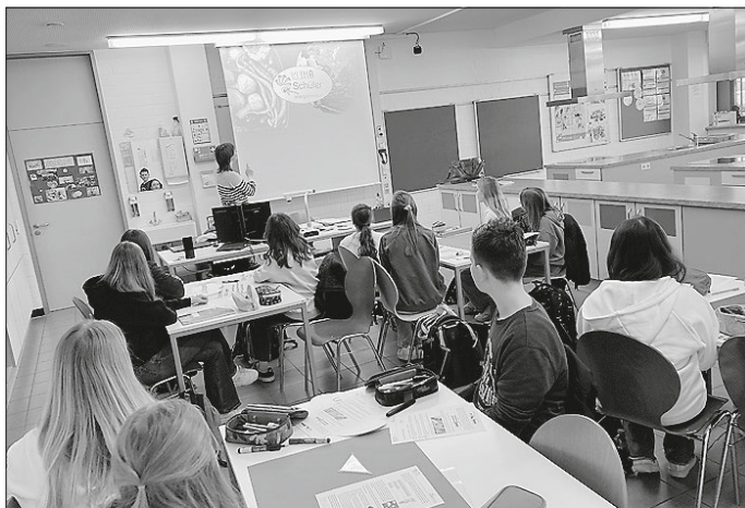
Bildquelle: Klimazentrum 7.4.2025

Wer Lust hat, sich aktiv für eine nachhaltige Zukunft einzusetzen, kann sich über die Diakonie für das FÖJ bewerben. Weitere Informationen gibt es auf der Website der Diakonie Württemberg oder direkt beim Klimazentrum unter klimazentrum-sha.de oder telefonisch unter 07904/94599-10.