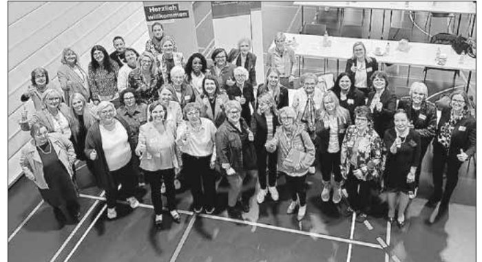
Gruppenbild mit einem Teil der Teilnehmerinnen

Insgesamt war es ein sehr erfolgreicher Bezirksdelegiertentag, der wertvolle Impulse für eine gute Krankenhausversorgung brachte.