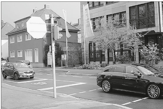
Aufgeweiteter Radaufstellstreifen in Schwabach

Der vorgezogene Radaufstellstreifen hilft dem geradeaus fahrenden Radverkehr gesehen zu werden.