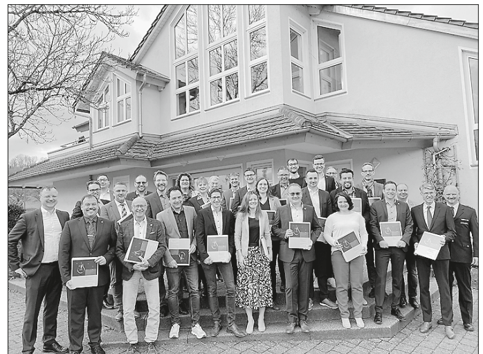
Die Vertreter der Städte und Gemeinden nahmen den Notfallplan entgegen.