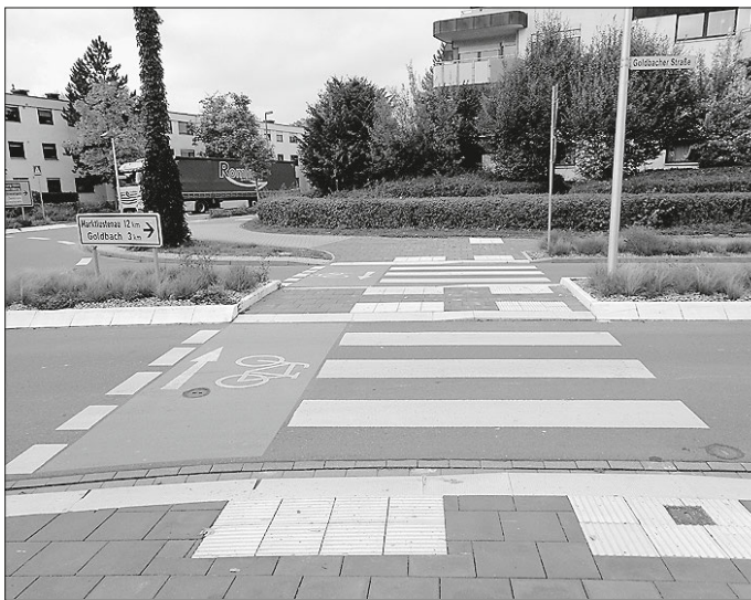
Zebrastreifen mit Radfurt (Crailsheim)

An Kreisverkehren ohne Zebrastreifen haben Fußgängerinnen und Fußgänger sowie Radfahrende, wenn der Radverkehr im Seitenbereich geführt wird, grundsätzlich Vorrang gegenüber aus dem Kreisverkehr ausfahrenden Fahrzeugen (Vorfahrt gewähren beim Rechtsabbiegen). Einfahrende Fahrzeuge müssen zu Fuß Gehenden und Radfahrenden keinen Vorrang gewähren.