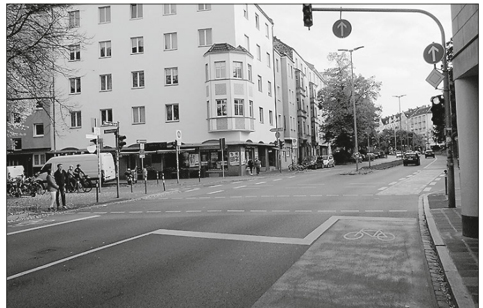
Vorgezogener Radaufstellstreifen in Nürnberg

Zumeldung zur Pressemitteilung des Ministeriums für Soziales, Gesundheit und Integration Baden-Württemberg vom 09.04.2024: