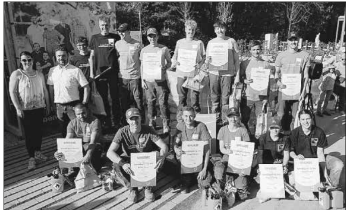
Die teilnehmenden Auszubildenden am Berufswettbewerb in der Sparte Garten- und Landschaftsbau.

Bei der Siegerehrung überreichte die SVLFG an alle Teilnehmenden Präsente, die dem Arbeits- und Gesundheitsschutz dienen. SVLFG