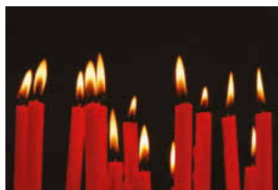
Musik: Ilse Holl

...die Kirche wird extra beleuchtet werden... Passende Texte und Musik versprechen einen Gottesdienst, der berührt und in diesen Herbst ein Licht hineinragen will.