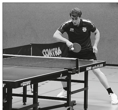
Dimi gelangen zwei Einzelsiege am vorderen Paarkreuz.