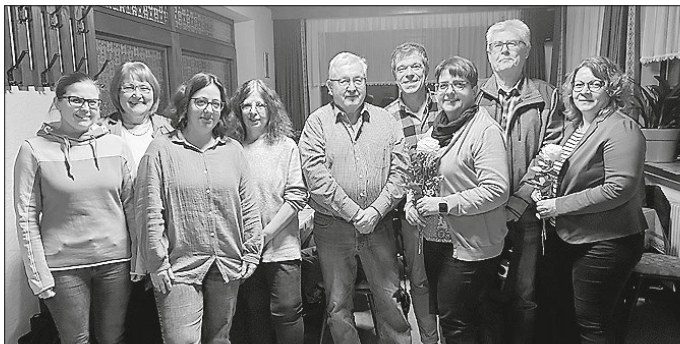
Alte und neue Vorstandsmitglieder