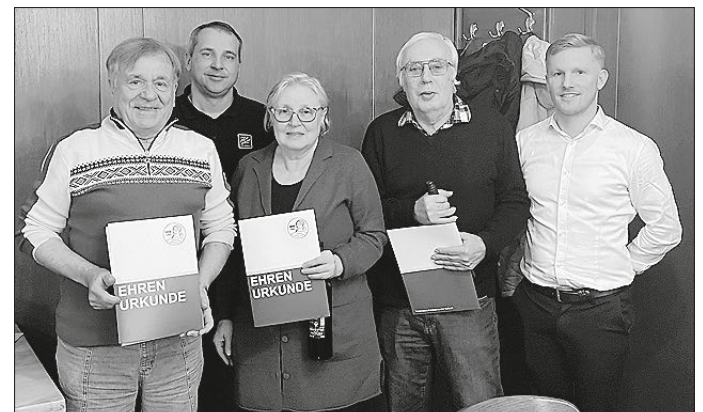
Die Geehrten zusammen mit dem 1. und 2. Vorsitzenden.

Mit einem positiven Ausblick auf das neue Jahr und großem Engagement geht der Tennisverein in die kommende Saison. Die steigenden Mitgliederzahlen und die Vielzahl an geplanten Aktivitäten zeigen: Der Verein ist auf einem sehr guten Weg.