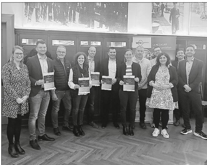
Auszeichnung der ersten fünf KLIMAFit-Betriebe im Landkreis Schwäbisch Hall